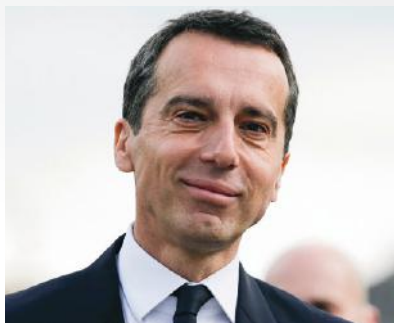
Презентация 2016: Канцлер Австрии Кристиан Керн

СОВЕТ: Регистрация на презентации и выставки компаний еще возможна – детали на странице 10.